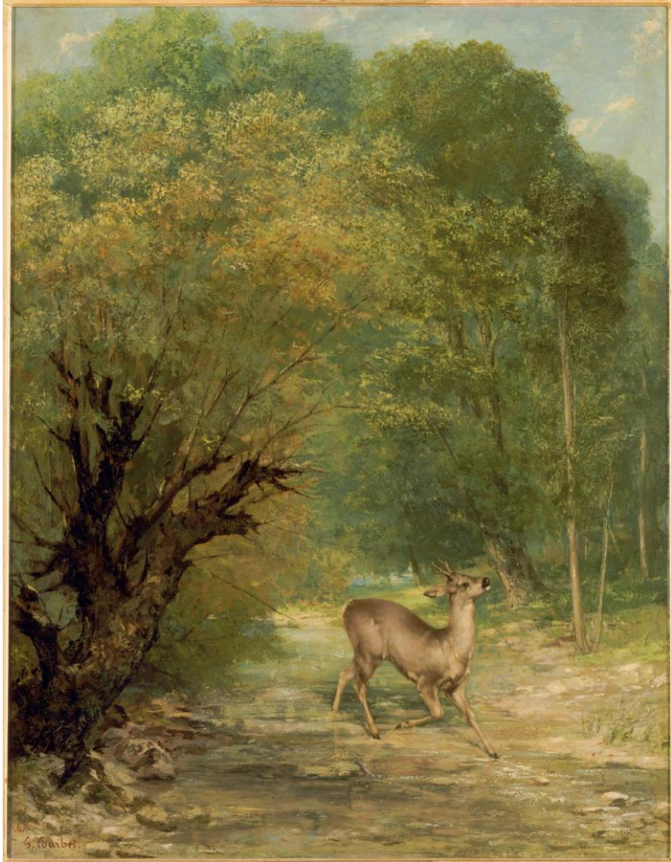
Gustave Courbet (1819-1877) Le chevreuil chassé aux écoutes, le printemps 1867